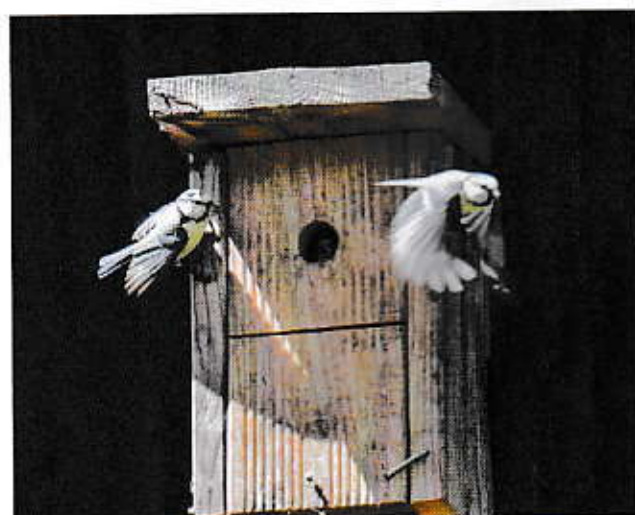
De één komt, de ander gaat!

Nog is de winter niet voorbij of we hangen de nestkastjes uit voor de mezen en ander pluimage, een torenvalkkastje of een zitstok. Een zwaluwnest of twee hangen ook al onder de dakgoot. Het 3D-printen van het zwaluwnest door de vogels zelf zit er niet meer in.