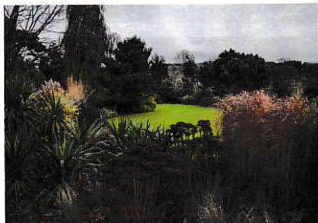
Wintergroen biedt beschutting.

Nu zitten de egels, als die er al zijn, in hun gekregen egelhuisje. Vleermuizen, mussen en roodborstjes hebben het niet onder de markt. Door de moderne gesloten woningbouw zijn er nog nauwelijks nissen of gaten. Alles zit potdicht, de herberg is gesloten. Kweek daarom gerust een hoekje dicht struikgewas, misschien met bruidsluier of bamboe. Daar is het knus keuvelen en overwinteren.