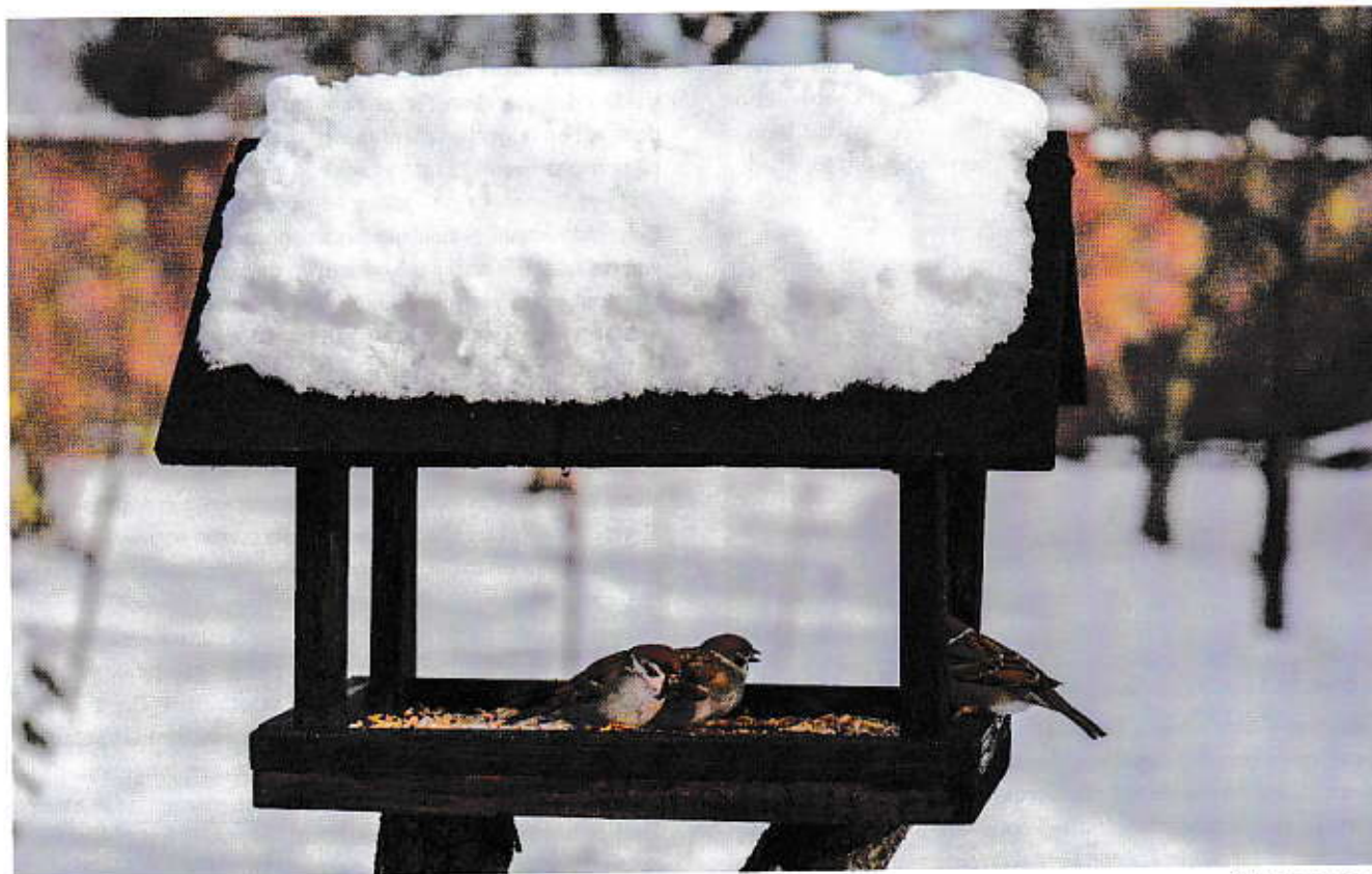
De tafel is gedekt.