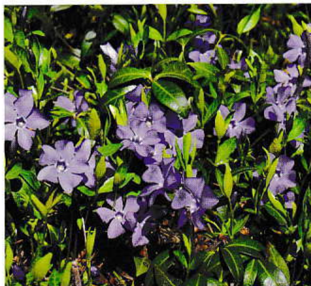
Maagdenpalm is een mooie, dichte bodembedekker die ook prachtige bloemen geeft.

Sommige bodembedekkende planten moet je wel onder controle houden, anders groeien ze alle richtingen uit en verdrukken ze de vaste planten in je tuin.