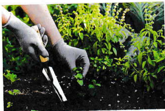
Heb je veel onkruid, leg dan bodembedekkers tussen je planten zodat je niet meer moet schoppen.

Een bodembedekker heeft nog andere voordelen. Zo houdt het het vocht langer in de bodem. De zon komt niet meer rechtstreeks in contact met de grond en de bodem zal niet meer verhard en korsten vormen. Perfect wanneer een hittegolf de kop opsteekt! Sommige bodembedekkers zullen ook de grond verbeteren. Als ze afbreken of composteren, verrijken ze de bodem met organische stof waardoor de bodemstructuur verbeterd wordt.