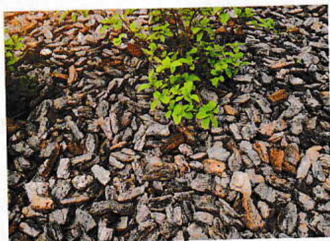
Schors als bodembedekker.

Een onderhoudsarme tuin is populairder dan ooit. We genieten graag van een mooie tuin, zonder er te veel tijd aan te moeten spenderen. Een bodembedekker kan daarbij helpen. Het gebruik ervan in je tuin is makkelijker dan je zou denken. In dit artikel vind je alle voordelen van bodembedekkers, waar je ze kan gebruiken en een overzicht van de verschillende soorten.